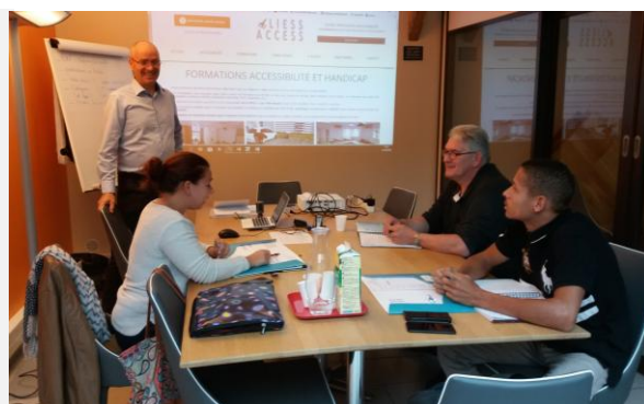
Session de formation à Paris (75)

Consultant-formateur qualifié OPQIBI pour la prise en charge du handicap, responsable et concepteur des formations, gestionnaire du réseau de professionnels HANDI-RENOV.